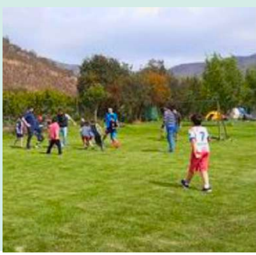
Cancha Baby fútbol